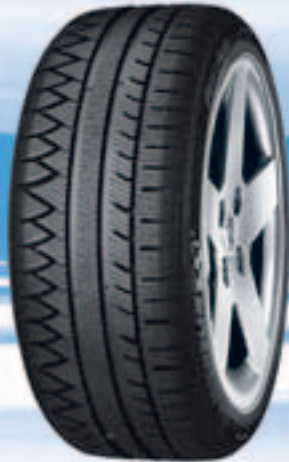
Pilot Alpin PA3