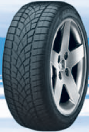
SP Winter Sport 3D