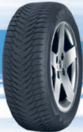
UltraGrip 8 MS