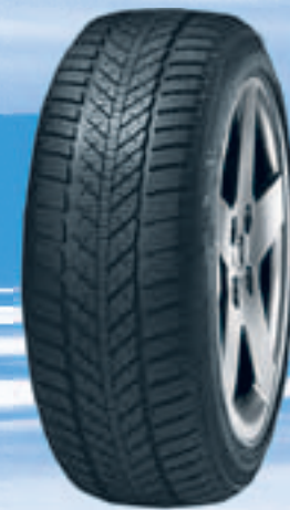
Kristall Control HP