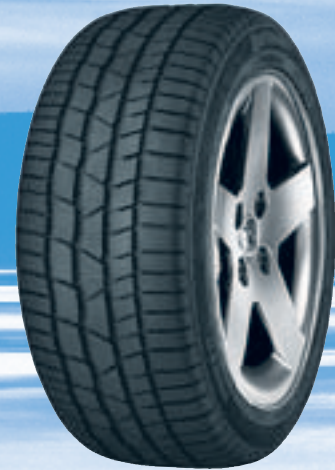
ContiWinterContact TS 830 P