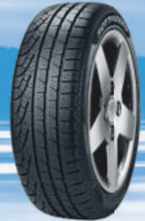
Winter Sottozero II