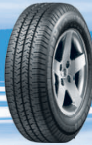
Agilis 51 Snow Ice